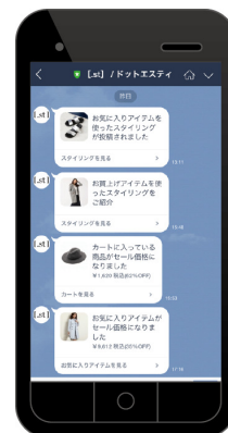
<.st[you]のパーソナライズメール>