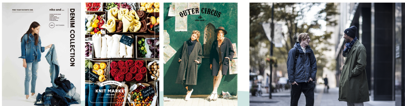
<秋冬シーズン販促企画の一例>