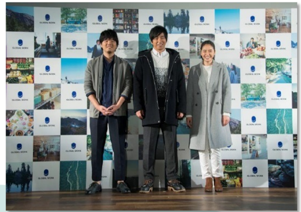
<秋冬新CM発表会 “ESCAPE” The Winter Party 2015 >

グローバルワークは第3四半期までの累計で売上高261億円 前年同期比118.2%と引き続き好調に推移しました。