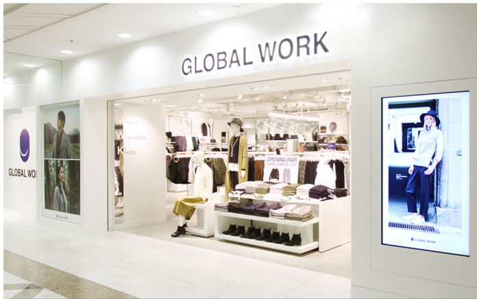
<池袋サンシャインシティ店>