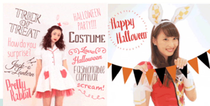
<ヘザー Heather Diary ハロウィンキャンペーン>