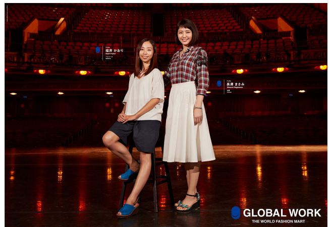
<『フク、フクフク。世界人・長澤まさみ』篇>