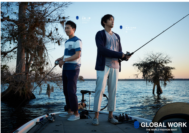
<『フク、フクフク。世界人・大沢たかお』篇>

グローバルワークは、「みんなのシアワセを紡いでいく」ことをテーマにしているブランドです。20周年を迎えた今年、日本から世界へ発信する世界展開ブランドとしての飛躍を目指し、「THE WORLD FASHION MART」というスローガンのもとに『フク、フクフク。世界人キャンペーン』を展開しています。