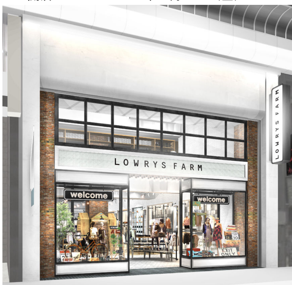
< 店舗外観イメージ >