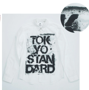
②小町 渉 作