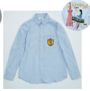
④竹内 俊太郎 作