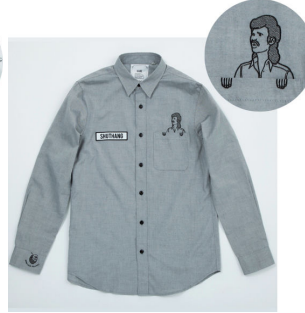
③Shu-Thang Grafix 作