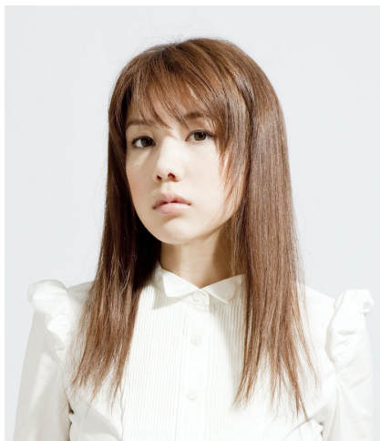
仲 里依紗(なか りいさ)