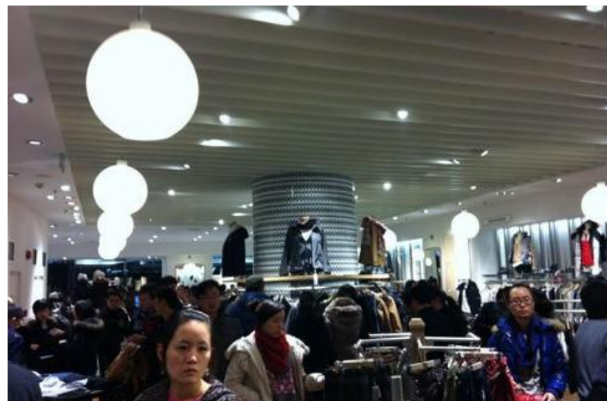
龍之夢（ロンチーモン）（12/18オープン）