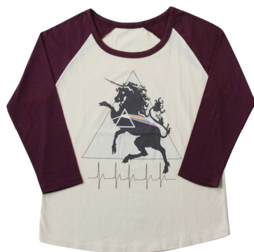
大阪会場 ラグランTEE

心斎橋OPA、京阪モール、HEP FIVE、南堀江、天王寺ミオ、なんばマルイ、EC SHOP