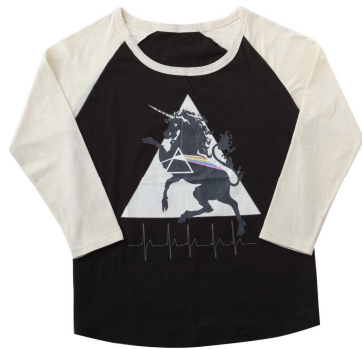
仙台会場 ラグランTEE