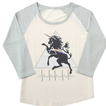
福岡会場 ラグランTEE