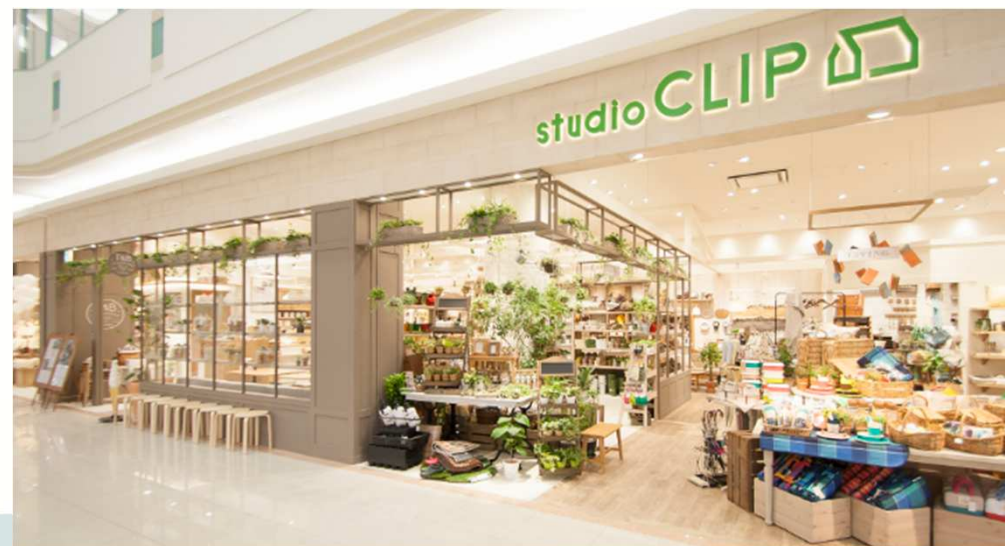
(スタディオクリップ ゆめタウン広島店)